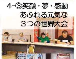
4-③笑顔・夢・感動 あふれる元気な 3つの世界大会