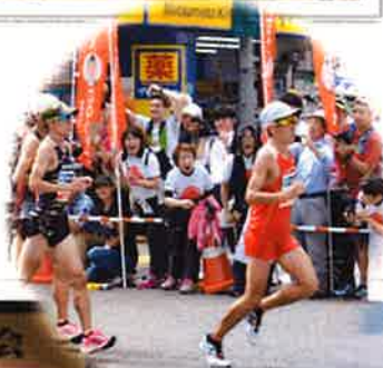
9/15 (日) MGC応援団活動にて