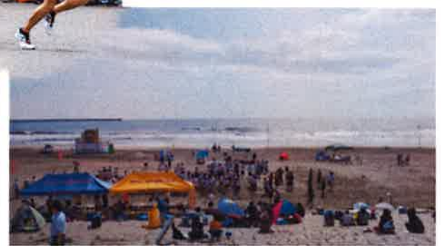
7/20(土)海開き&第10回ビーチ遊スポにて