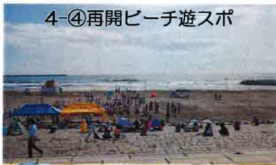
4-④再開ビーチ遊スポ