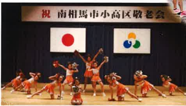
9/16(月・祝)9年ぶりに故郷で開催された敬老会にて