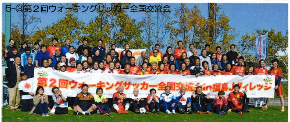
5-③第2回ウォーキングサッカー全国交流会