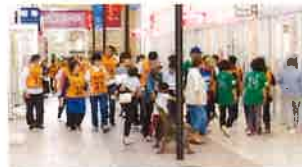
4-⑥ウォーキング 1周年記念祭