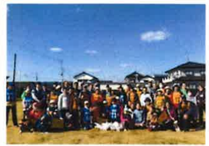
11/10 (日) 小高まちなか元氣俳句ingにて