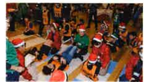
4-⑨小学生子どもスポーツ遊夢パーティー