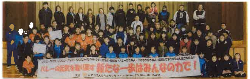
2 地域スポーツ事業