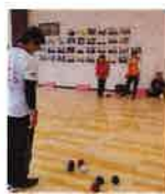
5-② めぐりあい ポッチャ 大会