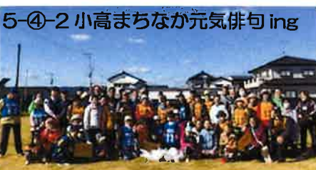
5-④-2 小高まちなか元気俳句ing