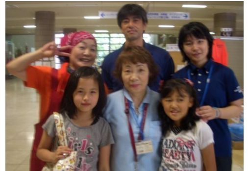
避難所の元気な子どもと

子どもたちは大変元気で、区域外登校している新しい学校にも慣れ、楽しく学校生活を送っているようでしたが、大人も子どももふるさとへの思いは同じで、一日も早く「安全な南相馬市」に戻れることを待ち望んでいました。