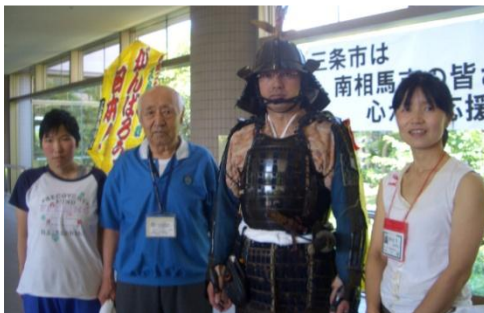
甲冑武者と記念撮影