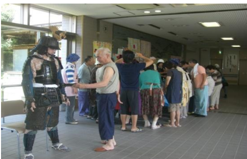
たくさんの手がテーブルに