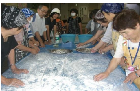
わい！わい！もちまるめ