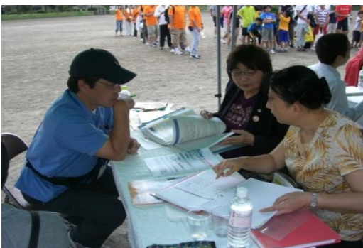
細部にわたって説明

午前10時から地元北区に避難している人や千葉県や神奈川県からも相談者が訪れ、4人の弁護士さんが、13人の方の真剣な相談に応じていただきました。