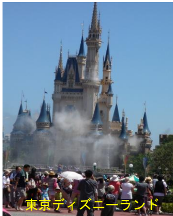
東京ディズニーランド