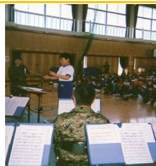
陸上自衛隊第12音楽隊

「みんなが私達のことを応援してくれている」という大きな勇気と希望をありがとうございました。今までの支援や励ましに感謝し、これからもみんなで力を合わせて、一歩ずつ前へ進んでいきたいと思えます。