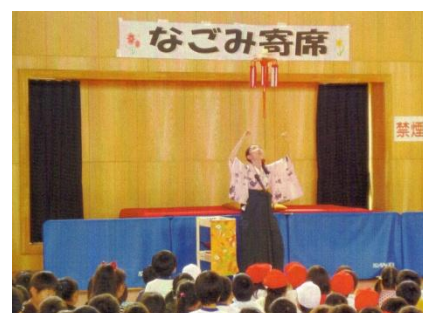
落語芸術協会公演「なごみ寄席」