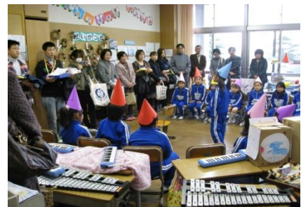
いきいき発表・1年生活科