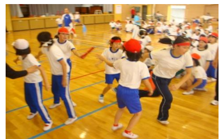
他校との交流・ミニ運動会（高学年）

【3学期から】〒975-0006 南相馬市原町区橋本町1-101 ☎0244-22-4114 Fax0244-24-2065