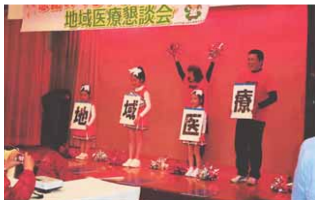
〈みなみそうま遊夢チアリーダー〉