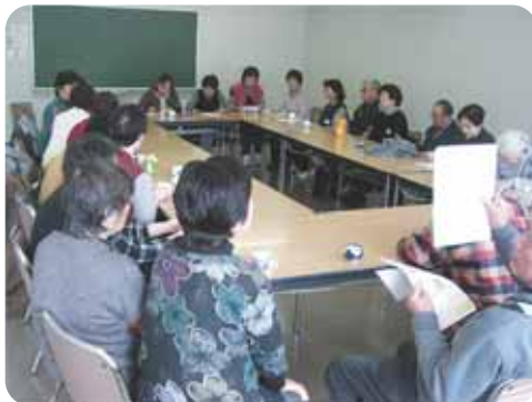
⑤お茶とおしゃべり