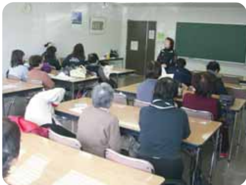
①はじめのあいさつ