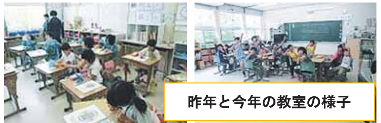
昨年と今年の教室の様子

心配したのは、児童同士が仲良く活動できるだろうかということでしたが、教師や保護者の心配をよそに、瞬く間に意気投合し、昼休みや放課後も校庭で一緒に遊ぶ姿が見られます。