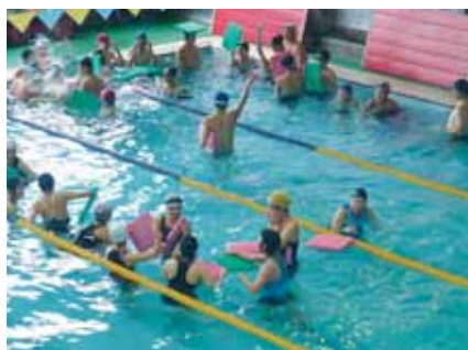
相馬アカデミーでの 集中水泳講習