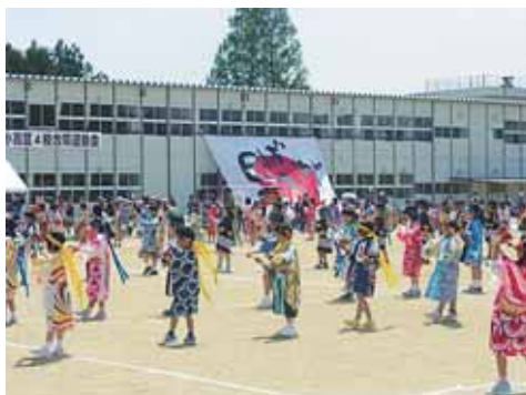
小高区4校合同運動会「よさこい」