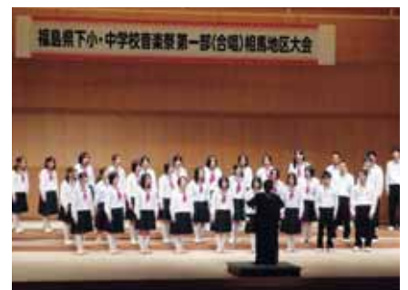
県下小中学校音楽祭 「第一部合唱」優秀賞