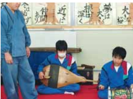
男山八幡神社宮司 による雅楽教室

このように、今年度は、すべてにおいて、「築き上げた人間関係」を基盤にした組織によって「秩序ある校内生活と信頼される学校づくり」を目指し、「授業の充実」「規範意識の徹底」「教師の指導力の向上」を経営の柱に取り組みでいきたいと思ひます。