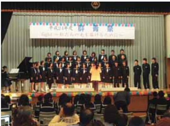
♪群青祭「合唱」…文化祭♪

今年度、小高中学校は、28名の新生入生を向かえ入れ、全校生徒91名で「高い志を持ち努力する生徒」の育成を教育目標にかかげ、新たなスタートをきりました。