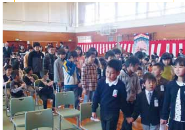
6年生に手を引かれて新1年生の入場 ようこそ新たな「小高っ子」

震災・原発事故による避難生活はまだ続きますが、小高区の小学校が一カ所に集まったことで、これまでとは趣の違う行事ができるようになりました。