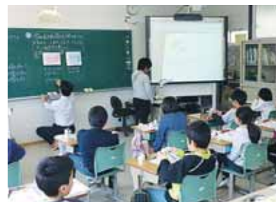
支援による電子黒板活用

鹿島中学校校庭に建てられた仮設校舎の2階で福浦小、鳩原小の2校と合同授業を進めています。震災により、それぞれの学校の児童数が減少し、複式学級となりましたが、合同授業により、少ない人数にならず各学年ごとに学習を進めています。