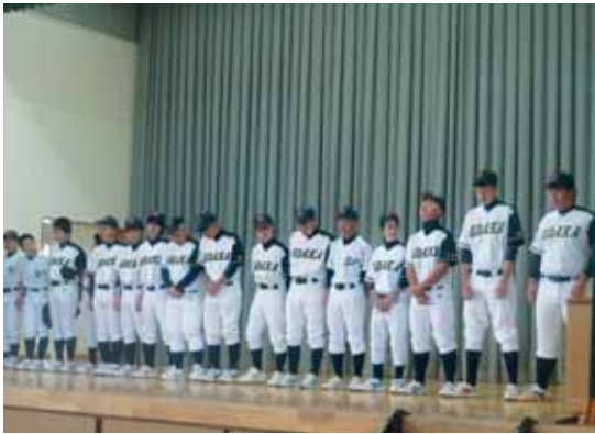
中体連選手壮行会