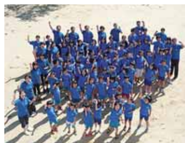
金鳩シャツでオッー！