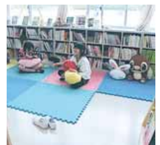
本に囲まれてのんびり

校舎には、今年から特別教室も新設されました。「全校生が入れる多目的室」「理科室」「音楽室」などがありますが、児童の人気の教室は「図書室」です。市の図書支援員の方がいつも部屋にいて、図書の整理をしたり、新しい本を紹介したりしてくれます。昼休みには、ここに児童がよく顔を出して、本を借りていきます。漫画から図鑑へ興味を広げる児童もいれば、推理小説や魔法の世界の物語にシリーズものをじっくり読む児童もいます。これから、もっと図書が身近になるよう工夫していきたいと考えています。