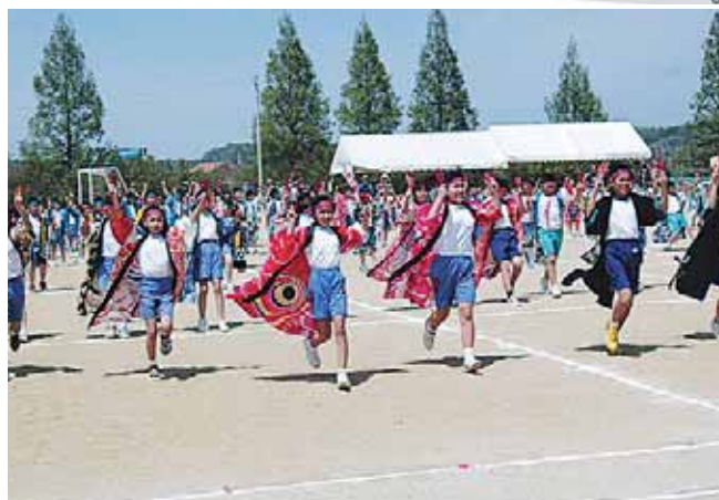
小高小児童にとって初めての「よさこい」 元気よく「やあっー！」