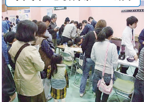
そうそうこども科学祭2015の様子

「そうそうこども科学祭」(相双地方振興局主催)では、小学生等に本校高校生の指導による“ものづくり”体験を行っています。