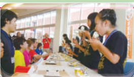
はらまちクラブ活動写真 H28.7/17：笑顔・夢・感動あふれる 元気な世界大会 アイスまんじゅう早食い/うですもうほか