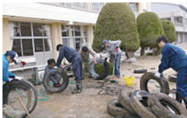
校庭の古タイヤの処分作業

目標達成に向けた真摯な取組は、本校の歴史に新たな原一魂を刻み込むすばらしいものでした。下級生も学習、運動、行事等にめあてを持って真剣に取り組んでいます。さらに、マーチングバンド部、合唱部、合奏部、合唱部、陸上部等の部活動も盛んに行われています。