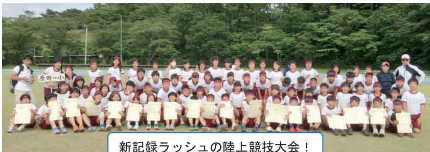
新記録ラッシュの陸上競技大会！

今年度本校は、全校生411名でスタートしました。入学式・始業式準備から運動会、委員会活動、熊本募金等学校の中心となり活躍してきた六年生。市内陸上大会では新記録5つを含む十九の大量入賞を果たしました。