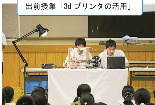
出前授業「3d プリンタの活用」

その他にも、ものづくりマイスター派遣による技能講習を実施したり、地域企業のご協力によりインターンシップや校内企業説明会を実施したりするなど、充実したキャリア教育の実践に努めることができいております。