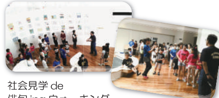
社会見学 de 俳句ing ウォーキング H28.8/20：南相馬市消防・防災センター