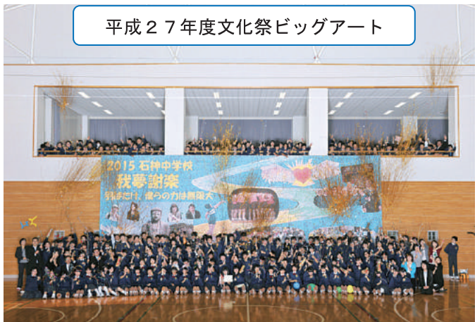
平成27年度文化祭ビッグアート

今年度の石神中生は238名。学習や諸活動にも落ち着いて取り組んでおり、生徒会活動が自慢できる学校です。生徒会主催で行われる俳写コンクールは、全校生徒はもちろん教職員も夏休みのベストショットと俳句による作品作りに取り組みます。