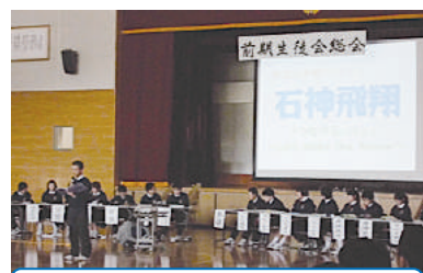
平成28年度生徒会スローガン

本年度の生徒会は、石神飛翔『つなげるバトン』～Let's Make Our Future～をスローガンに活動を行っています。これまでの成果を生かし、石神中生一人ひとりがバトンをつなぎながら、さらなるジャンプアップ「石神飛翔」を目指します。さらに、今年は30年もの長きにわたり続く、石神日英交流ロセット校訪問や震災以後初めてとなるロセット校生のホームステイ受け入れも予定されています。なお、本校の日常の教育活動につきましては、学校ホームページでも配信しております。お時間がありましたら、どうぞご覧ください。