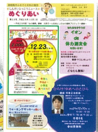
4-① しんさいふっこうニュース 「めぐりあい」発行