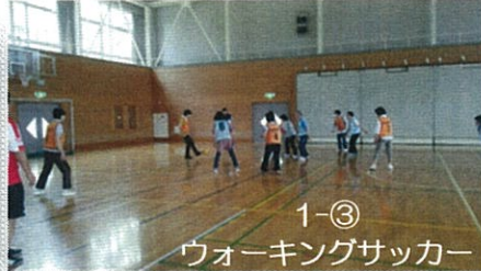
1-③ ウォーキングサッカー