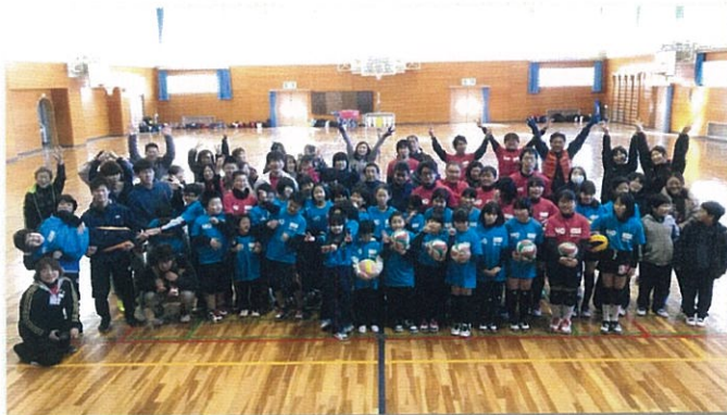
H30.1/13 小高ゆめクラブとして再開! 小高小学校体育館にて