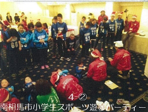
4-② 南相馬市小学生スポーツ遊藝パーティー