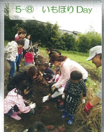
5-⑧ いもほり Day