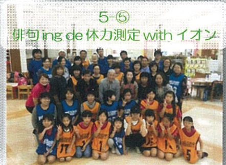
5-⑤ 俳句ing de 体力測定 with イオン