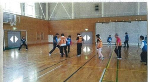
体験会を経てサークル活動開始! ウォーキングサッカー:月3回火曜日 10:00~11:30 小川町体育館にて

と き : 平成30年5月18日 (金) と ころ : NPO法人はらまちクラブ南相馬元気モール