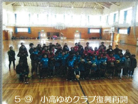
5-⑨ 小高ゆめクラブ復興再開