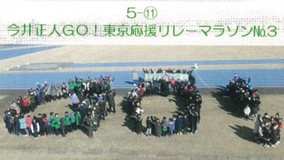
5-⑪ 今井正人GO! 東京応援リレーマラソンNo.3