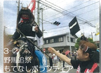
3-② 野馬追祭 もてなしボランティア