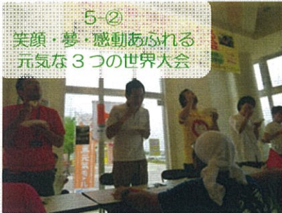
5-② 笑顔・夢・感動あふれる 元気な3つの世界大会