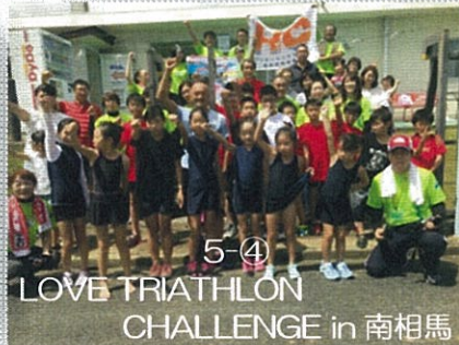
5-④ LOVE TRIATHLON CHALLENGE in 南相馬