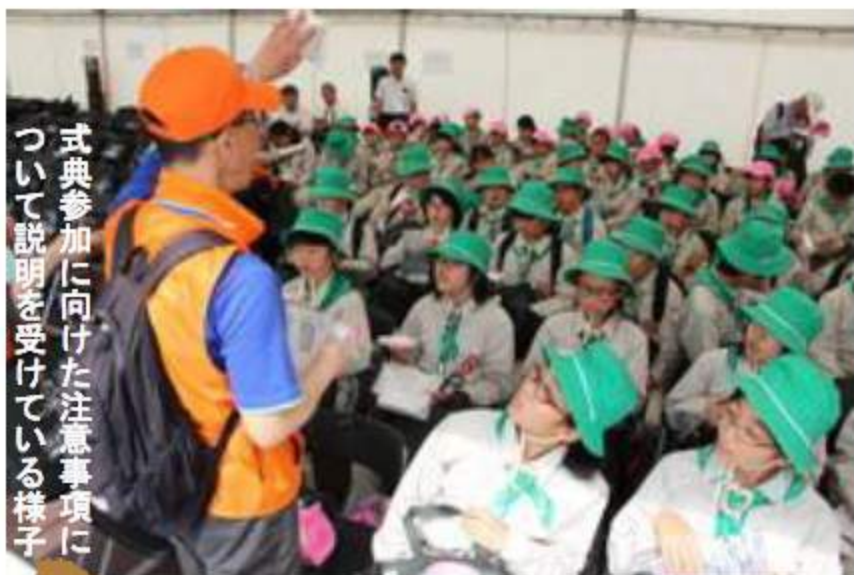
式典参加に向けた注意事項について説明を受けている様子

さて、ここ相馬地方では、天明・天保の飢饉で荒廃したふるさとを、北陸などからの移民政策や二宮仕法を取り入れ、復興に取り組んできた歴史があります。