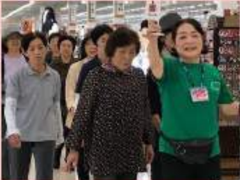
オープニングの様子