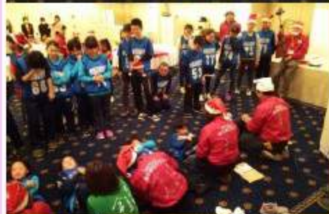
2017年 遊夢パーティーの様子