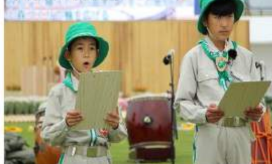
「緑の少年団代表メッセージ」を発表する児童

6月に全国植樹祭が本校学区（雫地区）で開催されました。福島県での開催は、実に昭和45年以来とのことです。大甕小学校からは、5・6年の代表児童が参加し、苗木の贈呈、各国大使等来賓植樹の補助、緑の少年団代表メッセージの発表等の役割を担いました。子どもたち一人一人が、大勢の人々の前でも臆することなく堂々と式典に臨んでいる姿にふれ、非常に誇らしく思った次第です。