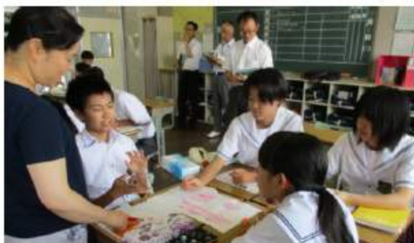
学び合い、支え合う学習の風景 グループでの学習を大切にしています。

現在本校は、生徒数233名、各学年3クラスに特別支援を加えて全11学級で日々の教育活動に取り組んでいます。今年度は、「学び合い、支え合う学校」をテーマに、互いに聞き合い、学び合う関係を大切にしながら、集団活動の充実を図っています。