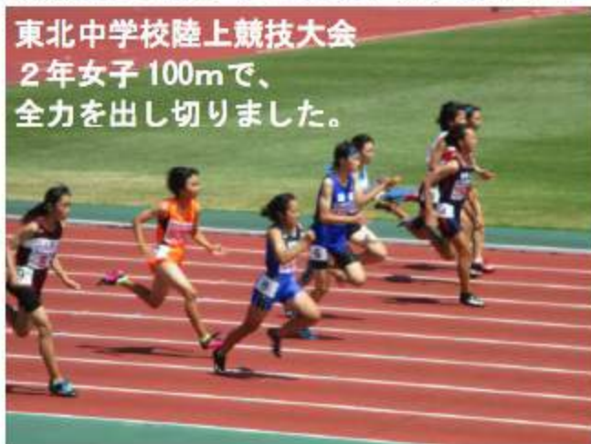
東北中学校陸上競技大会 2年女子100mで、 全力を出し切りました。

今年度は、部活動での成果もめざましく、中体連総合大会では、男子バスケットボール部、女子バスケットボール部、女子バレーボール部、男子ソフトテニス部、そして、男子バドミントン部がそれぞれ県大会に出場しました。また、陸上競技部では多くの生徒が県大会に出場し、女子2年100m、女子低学年4×100mRで東北大会出場を果たしました。