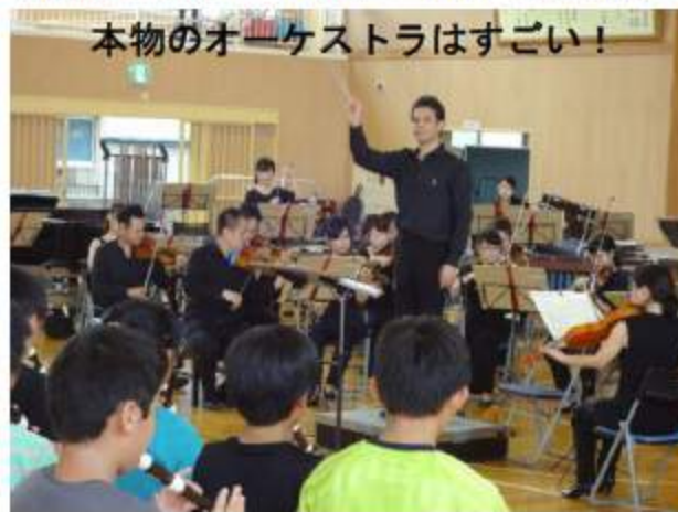
本物のオーケストラはすごい！

習に励み、地区音楽祭や敬老会で演奏を発表しています。三世代に受け継がれた伝統ある器楽部の活動を今後も大切にしていきたいと思