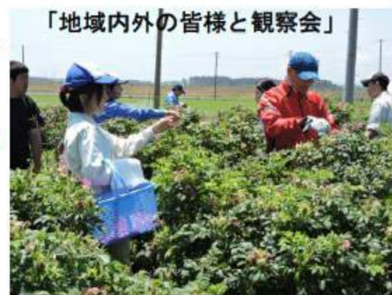
「地域内外の皆様と観察会」

本校では、震災以降「地域に元気を発信しよう」を合言葉に、農業分野で様々な活動を行ってきました。津波による塩害と、福島第一原発事故に伴う放射性物質の飛散に負けず、農業復活に期待を込めて始まった菜の花プロジェクトでは、菜の花の栽培と菜種油の生産を行い、「油菜（ゆな）ちゃん」という名称で商品化にこぎつけることができました。現在では食品科学科の生徒が中心となり三種類のドレッシングの試作と商品化に成功し、菜の花を通じた地域活性に一役買うことができました。