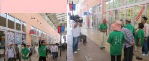
TVの取材も受けました